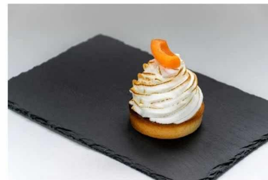
RÁKÓCZI TÚRÓS TART